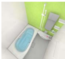
システムバス INAX ラ・バス Z-Type