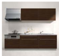
キッチン クリナップ KT フラットタイプ