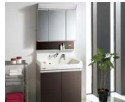
洗面化粧台 クリナップ S W750 3面鏡