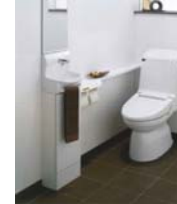
トイレ INAX ベーシアVX