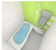
システムバス INAX ラ・バス M-Type