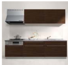
キッチン クリナップ KT 1型 2550