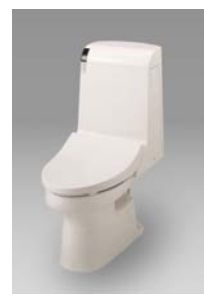
トイレ TOTO ZC1