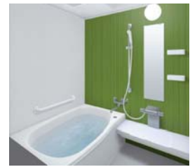
システムバス TOTO サザナ 1坪